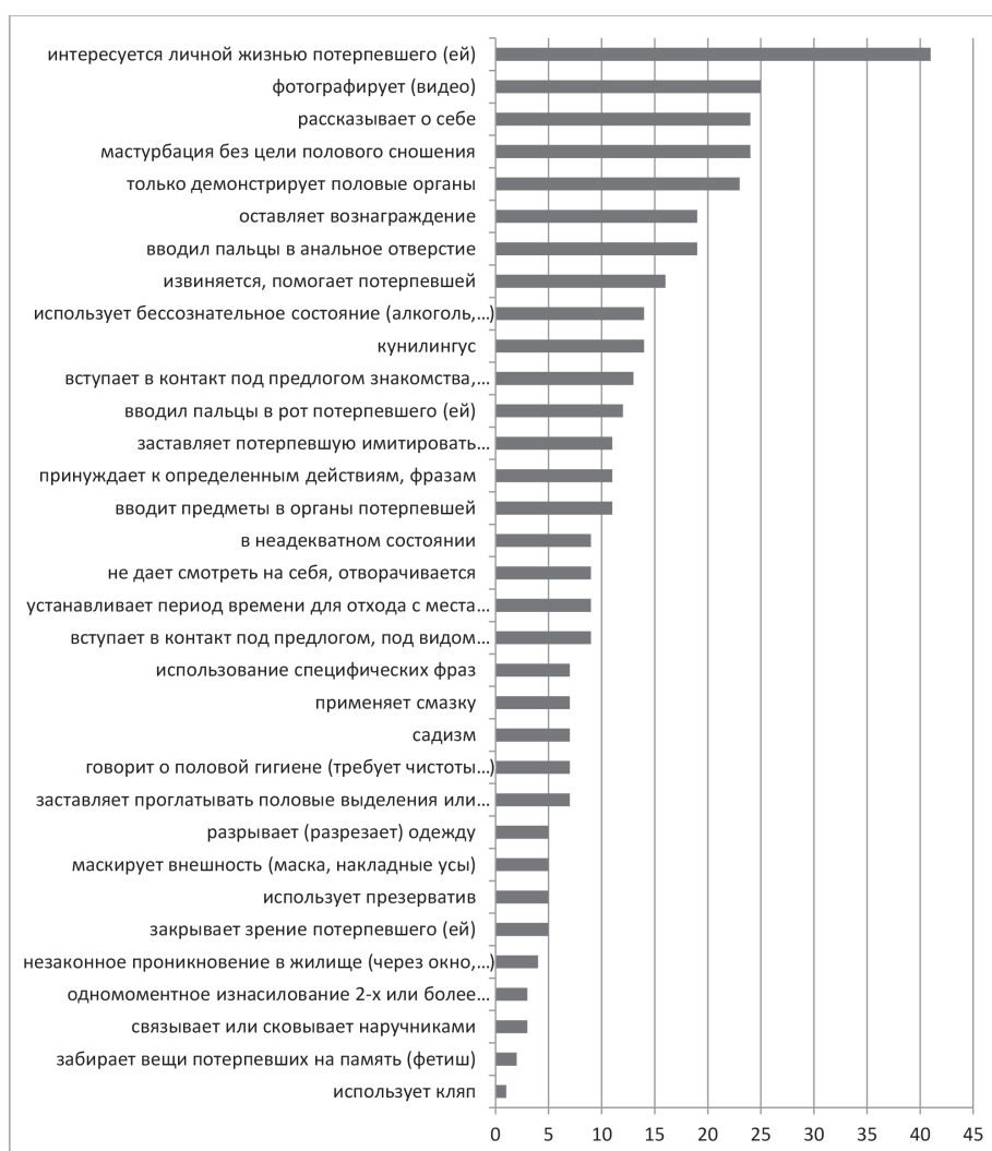
Рис. 1. Специфика действий преступника

Разработанные экспертные анкеты включали специфику действий преступника при совершении кибергруминга и преступления в реальности (рис. 1).