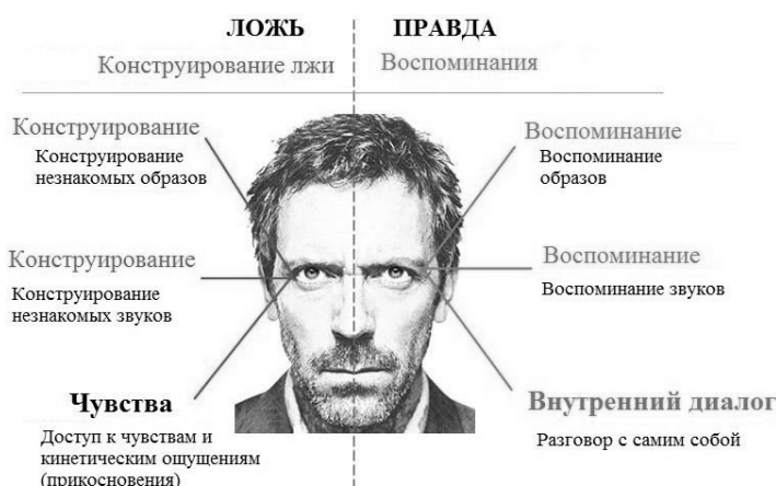
Рис. 1. Движение глаз при первичной обработке информации ассоциативной корой головного мозга

Как отмечает С. В. Ковалёв, умение отслеживать направление взгляда партнера по общению позволяет буквально «читать» его мысли, что очень ценно при проведении психофизиологических исследований. Такая способность дает возможность полиграфологу отслеживать достоверность сообщаемой обследуемым лицом информации, реально ли человек пребывал в той или иной ситуации либо она вымышленная.